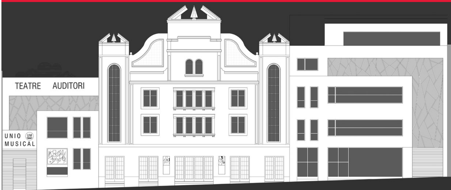
façana c/ s.miquel