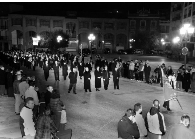
Participació de La Unió Musical en la processó del Divendres Sant

Por un nuevo acuerdo de la junta directiva de la Unió Musical tomado por unanimidad el día 27 de abril de 2010, esta colaboración con las fiestas remedianas se ha ampliado a un concierto gratuito que la Banda Juvenil realizará la semana de fiestas en el patio del Remedio. Ya hacía muchísimos años que no existía una colaboración tan estrecha entre la Unió y el Remei. Porque Nuestra Señora del Remedio, como Reina de la Música y Unionera Mayor Perpetua, siempre nos tendrá a su lado en los momentos más difíciles. Deseamos de todo corazón que las próximas fiestas del Remedio sean un éxito de participación y que sirvan una vez más para unir a la gran familia unionera y remediana.